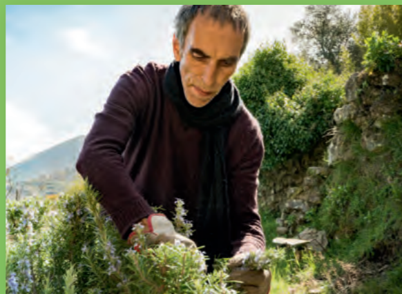
Die Kräutermischung für den Alpenkräuter Bio TeaStick wird zum Teil in Wildsammlungen gewonnen.